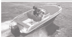
Cap Camarat 5.5 WA