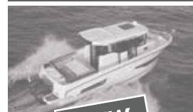
Merry Fisher 875 marlin offshore