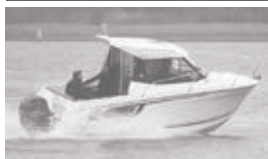
Merry Fisher 605